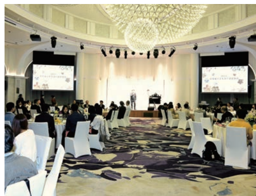
▲中華航空高雄分公司於11/14舉辦企業會員感恩餐會，並分享未來航線與機隊布局計劃。

為感謝南部企業會員長期支持，在時序趨近年末之際，中華航空（以下簡稱華航）高雄分公司特別於11/14舉辦企業會員感恩餐會，邀請企業會員夥伴同樂，除美酒佳餚外，還有趣味的串場活動與抽獎環節，與大家歡度愉快的週五夜晚。