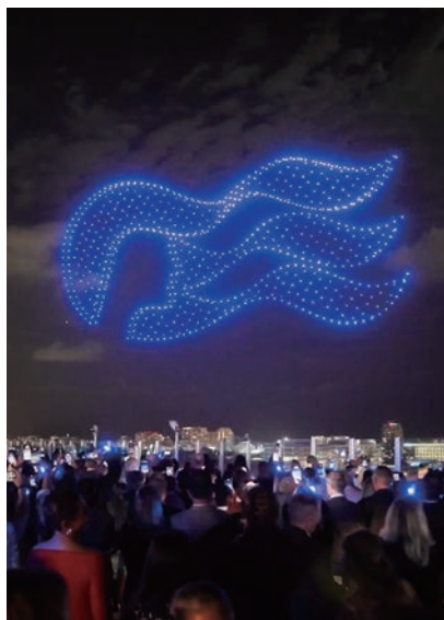
▲璀璨奪目的無人機燈光秀照亮夜空，向阿拉斯加壯麗航季的星辰公主號獻上了最美的致意。