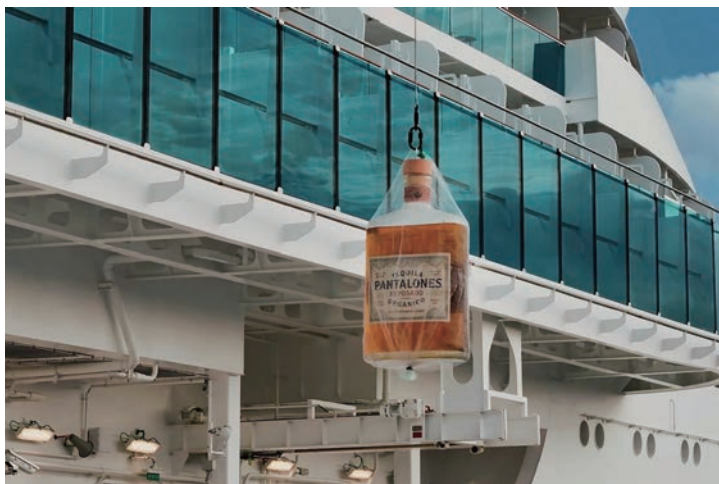
▲Pantalones有機龍舌蘭酒（Pantalones Organic Tequila）酒瓶擲向船首擊碎。

在充滿璀璨星光與動人時刻的盛大慶典中，公主遊輪最新且最具創新精神的星辰公主號（Star Princess），正式由好萊塢巨星馬修·麥康納（Matthew McConaughey）與卡蜜拉·艾爾維斯（Camila Alves McConaughey）夫婦正式命名，為這艘劃時代新遊輪揭開耀眼序幕。當晚，星辰公主號停靠於埃弗格雷斯港（Port Everglades），這對充滿活力的夫婦在延續數世紀的傳統航海命名儀式中，為遊輪舉行祝福典禮。他們用自家創立的Pantalones有機龍舌蘭酒（Pantalones Organic Tequila）酒瓶擲向船首擊碎，以擲瓶儀式祈願遊輪、賓客與船員航行平安與航程順利。