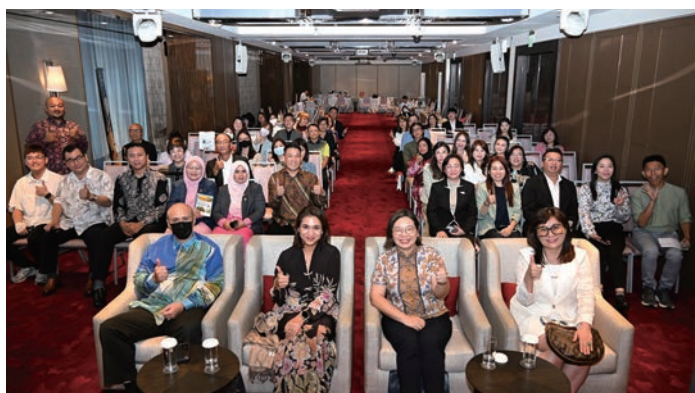
▲雪蘭莪州旅遊局於11/6來台舉辦旅遊推薦會暨商務洽談會。