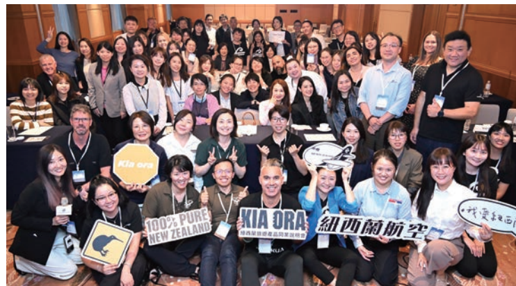
▲超過22家紐西蘭當地業者與超過70家台灣業者一起交流。

紐西蘭多個主要目的地正同步推動住宿、景點與活動體驗升級，從皇后鎮、瓦納卡到羅托魯瓦與奧克蘭，各地皆迎來新酒店開幕、活動設施增強，以及文化與自然體驗的深化。2025年至2027年，將是紐西蘭旅遊轉型的重要時期。