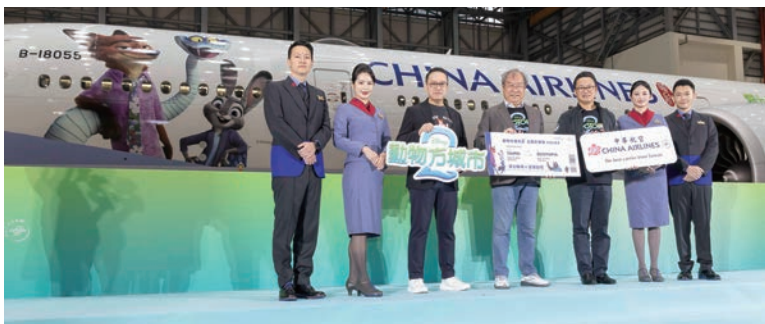
▲動物方城市2主題彩繪機於11／19正式出廠，由中華航空董事長高星漢（左4）、總經理陳漢銘（左5）與華特迪士尼公司亞太區影業發行及營運負責人徐隆立（左3）共同為首航揭開序幕。