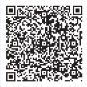
旅奇週刊官方網站

中華郵政臺北誌字第825號執照登記為雜誌交寄 本刊圖文版權所有，未經同意不得轉載或翻印！ All rights reserved.