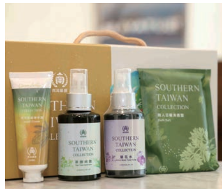
▲南灣嚴選禮盒匯集南台灣特色產品。

交通部觀光署雲嘉南風景區管理處（以下簡稱雲嘉南管理處）於11/20舉辦「TAIWAN WAVES OF WONDER」南區觀光圈國際推廣行銷影片暨成果發表記者會，正式啟動南區觀光圈國際宣傳與引客推廣新布局。活動結合品牌整合、跨域合作與國際踩線行動，全面展現南區觀光圈3.0階段在市場推廣、產品創新與國際連結上的具體成果，象徵台灣觀光邁向以品牌聚合、精準行銷及實質引客為核心的新時代。