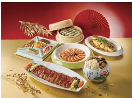
▲福容大飯店推出年菜外帶10人桌菜組合6,888元起。