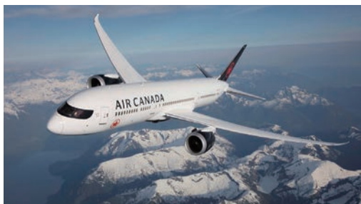
▲加拿大航空機隊目前有32架787-9客機，是目前長程航線的主力機型。

看好2026年世界級足球賽事熱潮，加拿大航空今宣布推出「2026北美全航線促銷」活動，即日起至11/23止，旅客透過加拿大航空官網或指定旅行社，凡購買2026/7/18前，台灣出發經由亞洲各轉機點至加拿大及北美城市之機票，可享優惠85折起，最低17,144元起就可搭乘獲得「北美最佳航空公司」肯定的加拿大航空，輕鬆暢遊