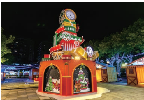
▲「魔幻時鐘塔」矗立在站前廣場中間，成為最吸睛的焦點裝置。

耶誕城最受矚目的主燈，今年化身為充滿歡笑的「歡樂馬戲棚」，紅白相間的舞台上，趣味裝扮的LINE FRIENDS們可愛亮相，週邊以錯綜繽紛的3角旗點綴，為民眾帶來滿滿童趣與驚喜，是來到耶誕城的打卡首選。市府1樓大廳同樣是必訪熱點，整個空間搖身一變成馬戲團園區，中央有「熊大探險號」熱情邀請大家乘上耶誕雪橇熱氣球，一同展開奇趣旅程，而兩側的lenini、鰻頭人與莎莉也熱情迎接每一位來賓，打造最適合互動玩樂的歡樂場所！捷運環狀線板橋站南廣場區域還有華麗的耶誕精靈交響樂展演裝置「耶誕精靈馬戲派對」，動態燈光與裝置變化完美結合，伴隨歡快的耶誕樂聲，營造出繽紛爛漫的馬戲節慶氛圍，絕對值得駐足欣賞。