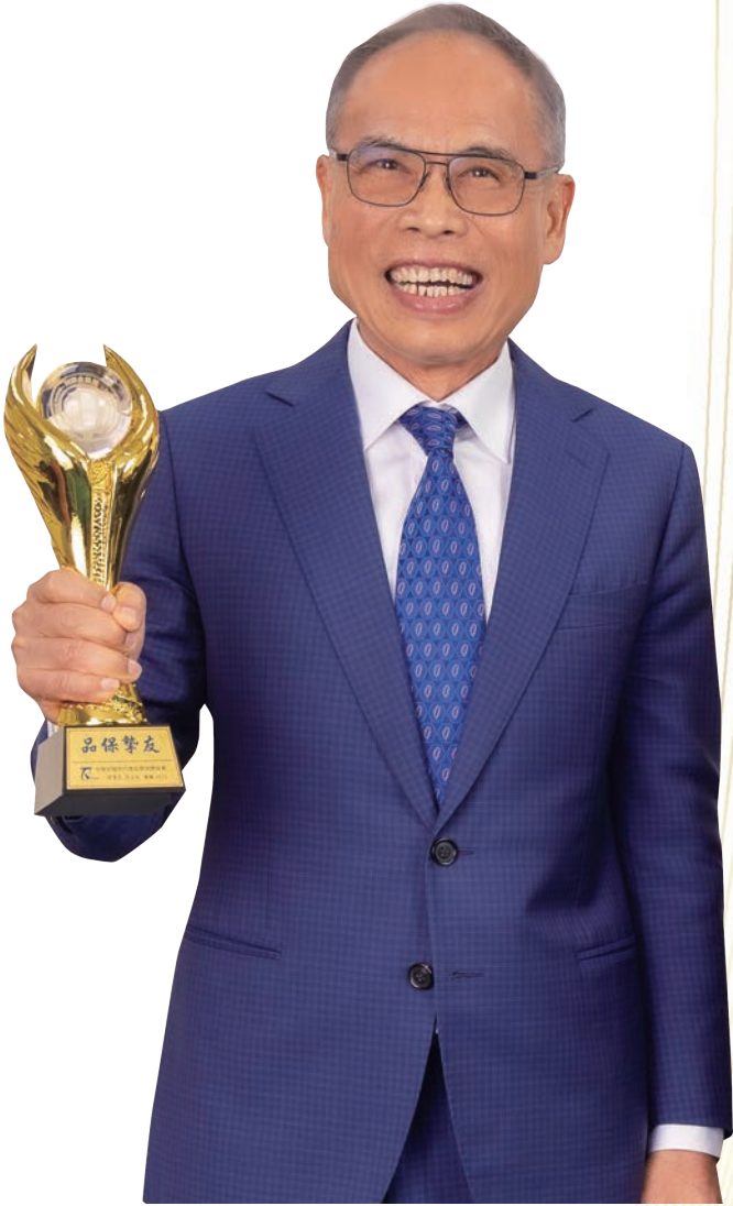
旅行業品質保障協會理事長

藉由國際金旅獎的標準化審核與國際評選機制，品保希望為業者提供第三方品質背書、建立品牌形象，使認證成為消費者的信賴來源，也讓旅行社在訂定價格時更具底氣，最終帶動產業欣欣向榮。