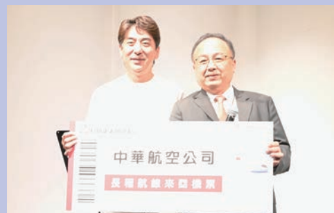
▲活動抽出區域線與長程線商務艙及經濟艙機票大獎，炒熱現場氣氛。