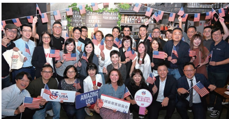
▲美國館特別於11/7舉辦「USA Partner Happy Hour」，邀請業界貴賓共享美酒佳餚。

睽違7年，Visit USA美國旅遊推展協會攜手AIT美國在台協會、ASOA美國各州政府辦事處協會及Brand USA美國國家旅遊局，盛大回歸2025 ITF台北國際旅展，推出「USA Pavilion美國館」，展現豐富多元的美國旅遊魅力。為感謝各界支持，美國館於11/7晚間在Tempo House舉辦「USA Partner Happy Hour」，邀請業界貴賓共享美酒佳餚。展出陣容龐大，包含在台23個美國州政府、加州內陸帝國及德州休士頓旅遊局，以及Eagle Rider飛鷹騎士、尊榮假期、Klook與格緻旅行社等業者共同參與。會員單位如AVIS艾維士租車與達美航空亦設有攤位服務，展現完整的旅遊合作網絡。旅展期間亦天天舉辦機票抽獎，讓旅客有機會飛往夢想中的美國目的地。