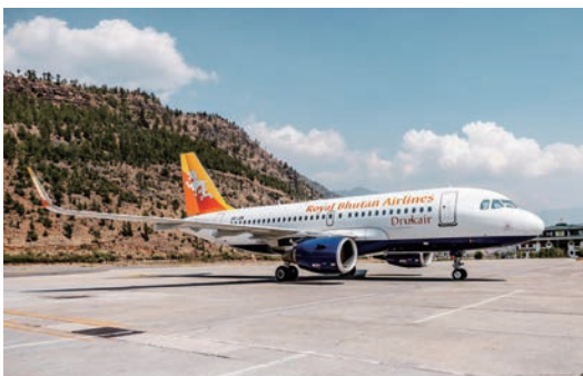
▲在不丹皇家航空授權、台灣民航局核准下，上豪國際旅行社正式成為不丹皇家航空台灣總代理。