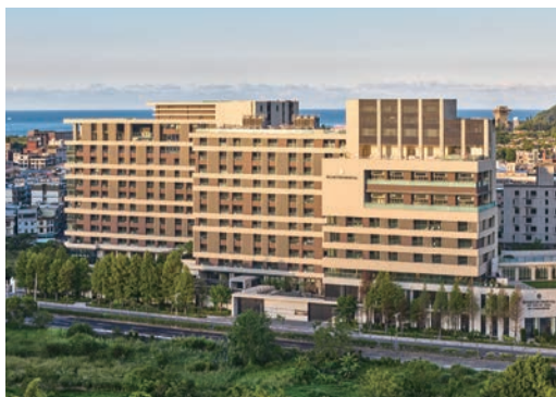
▲新北北海溫泉洲際酒店融入金山元素，打造出奢華的住宿空間。