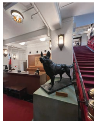
▲飯店內有許多特別的雕塑裝飾。