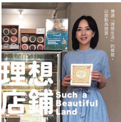
▲理想店鋪將花蓮理想大地渡假飯店的經典美味帶到大台北之中。

選用花蓮純正蜂蜜，搭配法國鐵塔牌奶油、天然養生黃金蛋等食材，以西班牙傳統蒸烤法製作，出爐的成品切開便能看見如蜂巢般的紋理，搭配著濕潤、柔軟的濃郁香氣，這便是獲獎無數的花蓮理想大地渡假飯店招牌之一：蜂巢糕。