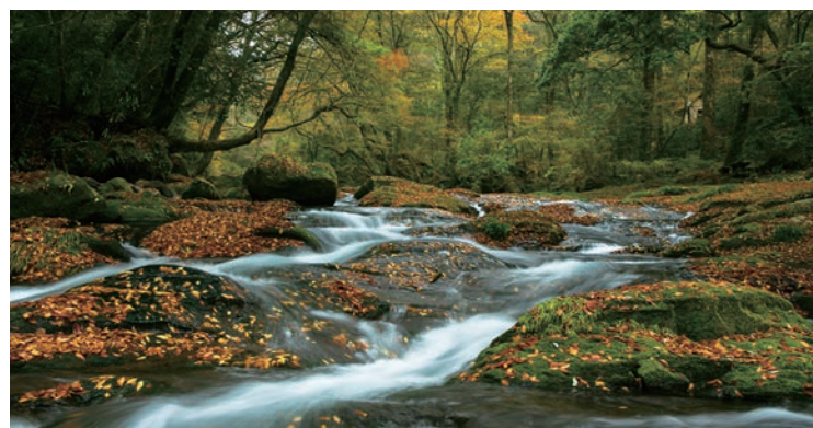
▲「菊池溪谷」不僅入選「日本明水百選」更有「日本瀑布百選」及「日本森林百選」等紀錄。

隨著九州地區進入楓紅季節，熊本縣菊池市成為秋季旅遊的熱門目的地之一。根據熊本縣觀光聯盟資料，菊池溪谷被列為「熊本縣賞楓名所前5名」，每年11月中旬至12月上旬為最佳觀賞期，壯麗的紅葉景緻吸引眾多國內外遊客前來觀賞。像是被列入「日本名水百選」菊池溪谷楓紅、以「美人湯」聞名的菊池溫泉、以地雞窯燒為特色的「森の味処なかむら」，以及百年老店和菓子「松風」、「Cocco Farm」手作布丁、「Melon Dome」哈密瓜波蘿麵包，為3大甜點控必買伴手禮，適合同業安排半日遊行程，讓旅客可在菊池體驗賞楓、溫泉、美食與伴手禮等多樣魅力。