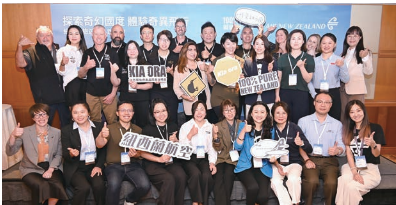
▲紐西蘭觀光局與紐西蘭航空，攜手舉辦2025紐西蘭旅遊產品說明會。