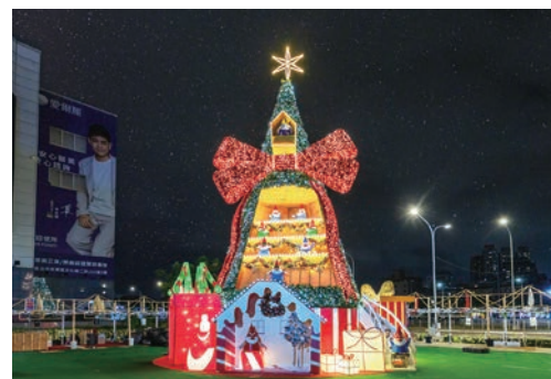
▲捷運環狀線板橋站南廣場的「耶誕精靈馬戲派對」，將華麗的動態燈光與裝置變化完美結合。

站前廣場今年則打造成「歐洲夢幻童話村」，讓人彷彿走進童話繪本實境！復古歐風小屋在燈光映照下閃耀光彩，街道間瀰漫著浪漫夢幻的氛圍。其中，由禮物盒與緞帶交織而成的「魔幻時鐘塔」矗立在中間，成為最吸睛的焦點裝置。隨著時間流轉，神祕禮物盒會驚喜開啟，LINE FRIENDS minini角色萌趣現身，伴隨漫天飛舞的雪花飄落，讓人盡情沉浸於雪國童話的迷人世界中。而走訪萬坪公園「minini歡樂點心小鎮」，每個角落都散發著甜蜜的快樂氛圍，處處都是打卡亮點，邀請大家與LINE FRIENDS minini角色一起踏上無限想像的童趣奇遇，留下美好的回憶時光！府中廣場則以「LINE FRIENDS冒險遊樂場」為主題，打造充滿歡笑與活力的歡樂天地。可愛的LINE FRIENDS角色們化身遊