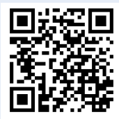
日本旅遊情報局粉絲團