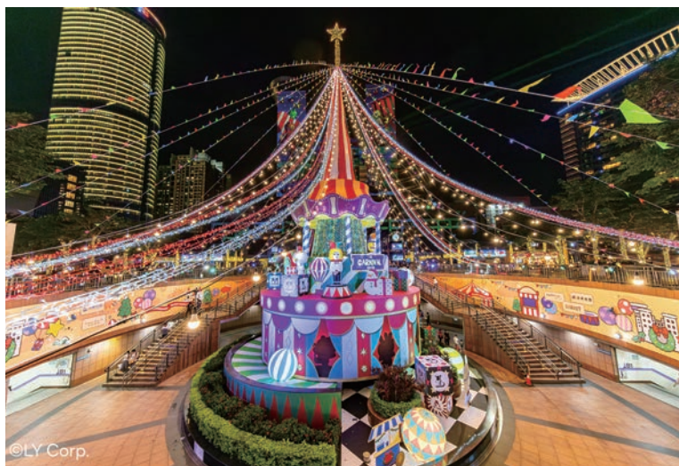
▲新北歡樂耶誕城最受矚目的主燈「歡樂馬戲棚」，為民眾帶來滿滿童趣與驚喜。