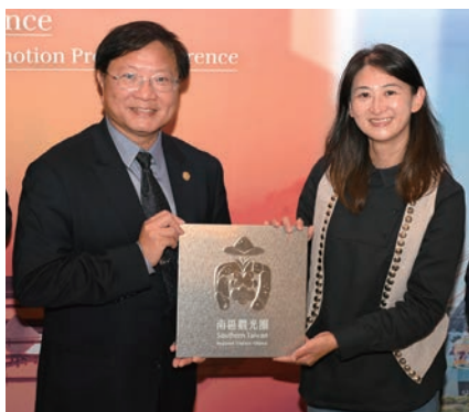
▲以「南」字設計，正式啟動南區觀光圈國際宣傳與引客推廣新布局。