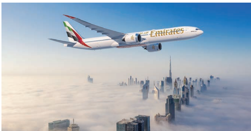
◀阿聯酋航空於2025杜拜航空展宣布訂購65架波音777X飛機，總值達380億美元。

全球最大的國際航空公司阿聯酋航空，於2025年杜拜航空展首日宣布追加訂購65架搭載奇異GE 9X發動機的B777-9飛機，總價值380億美元。此次訂購將使阿聯酋航空向波音下訂的寬體飛機總數達到315架，其中包括270架波音777X、10架波音777F貨機和35架波音787；同時，其向奇異航太（GE Aerospace）訂購的GE9X發動機總數達到540具，包括11／17簽署的130具新