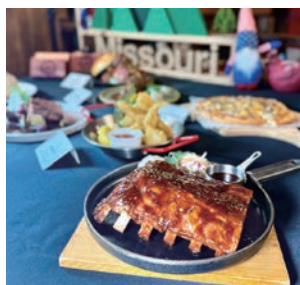
▲開場的「密蘇里風味香辣煙燻肋排」是整份菜單的靈魂所在。肋排帶有適度的柔嫩口感，表層裹滿熱辣微甜番茄醬，風味濃郁而富有層次。

ABV Bar & Kitchen啤酒餐廳領導品牌旗下的ABV美式餐酒館，以美國各州料理與啤酒文化為核心，致力於重現美國各地經典的餐桌風味。這1季的主題菜單，旅程來到美國的心臟地帶—密蘇里州（Missouri）。這裡曾是藍調音樂由南方傳向全美的重要中繼點，也是美式煙燻烤肉與家鄉料理的靈魂所在。密蘇里人將音樂與美食視為生活的一部分，煙燻的香氣、甜辣的滋味與自由的節奏，