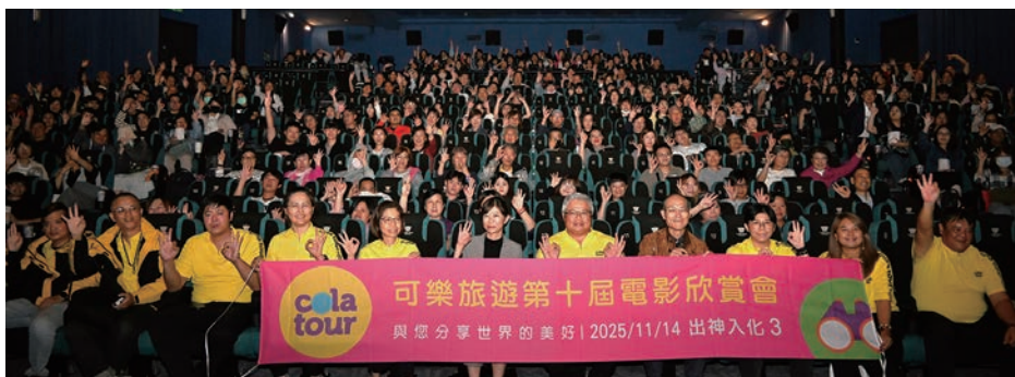
▲可樂旅遊於11／14舉辦2025年同業電影欣賞會。