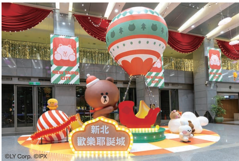
▲市府1樓大廳中央有「熊大探險號」，熊大熱情邀請大家乘上耶誕雪橇熱氣球。

年創造網路話題的新北歡樂耶誕城，今年攜手國際級人氣IP「LINE FRIENDS & LINE FRIENDS minini」共襄盛舉，打造史上最大規模、最多機械動態裝置的馬戲嘉年華場景，分布在市民廣場「星空馬戲園區」、站前廣場「歐洲夢幻童話村」、萬坪公園「minini歡樂點心小鎮」以及府中廣場「LINE FRIENDS冒險遊樂場」等4大特色燈區，一同點亮全台最歡樂逗趣的冬日馬戲嘉年華盛事！