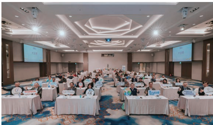
▲「北區觀光圈策略座談會」，集結縣市政府代表、觀光產業公協會、旅行業者與產業夥伴，展現產官學共同推動北台灣觀光發展的高度決心。