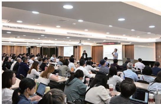
▲旅行業品質保障協會舉辦北、中、南區旅遊糾紛教育訓練課程，台北場吸引百位業者報名參與。

2023年7月，交通部觀光署正式委任旅行業品質保障協會（以下簡稱品保協會）受理旅遊糾紛調處職務，同年品保協會開始推動「調處委員職能認證培訓」，並以降低旅遊糾紛為首要目標，盼提升旅業品質、保護消費者權益。為持續增進同業應對旅客糾紛之專業能力，品保協會特於北、中、南舉辦旅遊糾紛教育訓練課