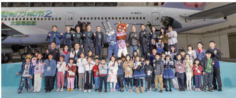
▲電影人氣主角驚喜現身彩繪機亮相記者會，與超過百名華航員工及親屬一同參與首航盛事。

中華航空（以下簡稱華航）「動物方城市2主題彩繪機」11／19正式出廠，首航台北－洛杉磯，超人氣主角胡尼克（Nick Wilde）及哈茱蒂（Judy Hopps）驚喜現身，掀起全場最高潮，超過百名華航員工及親屬熱情參與，以滿滿的笑容與歡樂，見證這場繽紛的首航盛典。華航「動物方城市2主題彩繪機」是全台第1架迪士尼彩繪機，以777-300ER擔綱執飛，旅客自報到起，從登機證、行李名條、座椅頭墊紙、機上餐