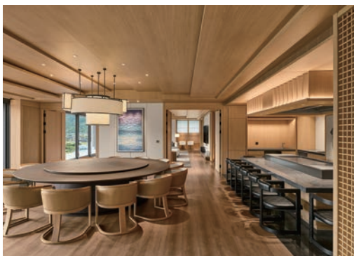
▲酒店設有新北市最大坪數總統套房，更是首間配有鐵板燒私廚的套房。

座落於金山溫泉區，由洲際酒店集團（IHG）與興富發建設攜手合作，於即日起迎來新北市北海岸首間國際級奢華溫泉酒店「新北北海溫泉洲際酒店」。開幕專案「際遇金山」，凡預訂連續入住2晚以上，即享每日免費早餐2客、獎勵積分5,000點與單臥套房保證升級券等禮遇。酒店擁有主館與別館共計211間客房，房內均備有私人獨立的氯化物硫酸鹽泉泡