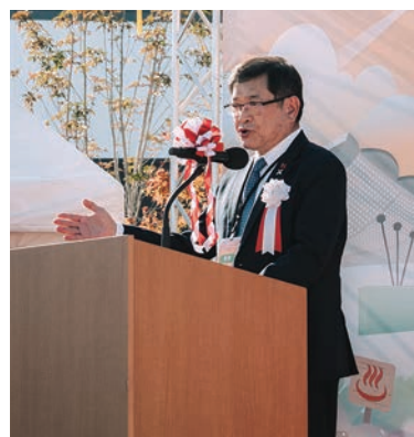
▲桃園機場公司董事長楊偉甫。

場以來，兩機場持續致力於串聯地區與人群，此次活動更是雙方合作關係的重要成果。未來將持續與桃園國際機場合作，透過航空網絡與觀光交流，為台日雙方的發展作出貢獻。