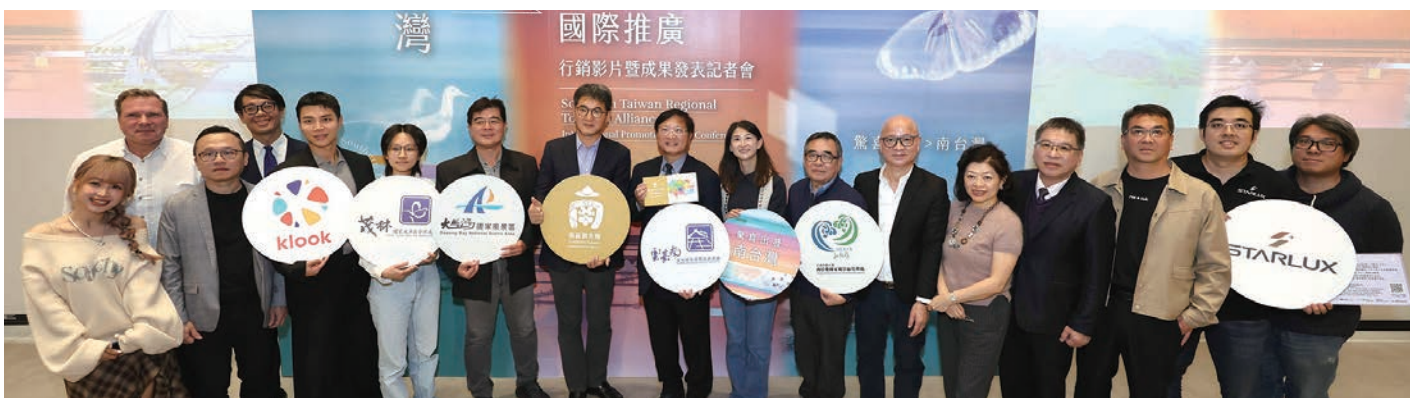
▲雲嘉南管理處於11/20舉辦「TAIWAN WAVES OF WONDER」南區觀光圈國際推廣行銷影片暨成果發表記者會。