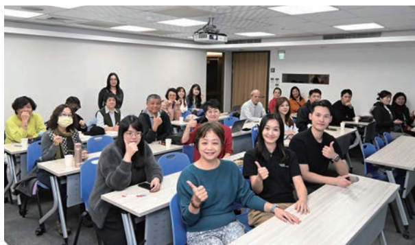
▲Kuoni Tumlare舉辦埃及與希臘旅遊同業說明會，同時向同業介紹其在近期設立的全球目的地部門服務內容與優勢。（第1排左起）Kuoni Tumlare 品。