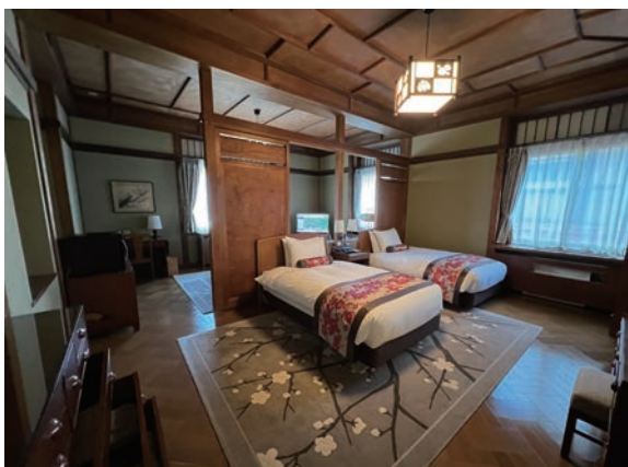
▲歷史悠久的花御殿小型雙人房。 ▼富士屋飯店史料展示室。

迎賓大廳位於本館，是富士屋飯店最具代表性的空間之一。西式建築架構結合日式細節設計，從唐破風屋頂、八角形屋簷，到玄關內鋪著紅地毯的氣派大階梯，都呈現出明治至昭和時期的藝術工藝。館內大量雕刻、彩繪、瓷磚與木作細節豐富，宛如走進一座活的美術館、博物館。