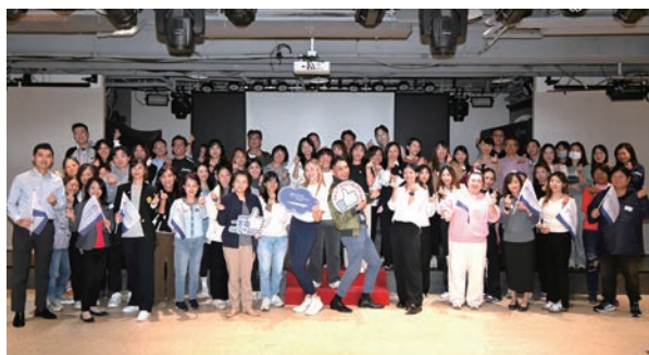
▲天合聯盟舉辦今年度第3場活動，邀請盟航與旅遊業者一同在舞蹈中放鬆身心、專注自我。