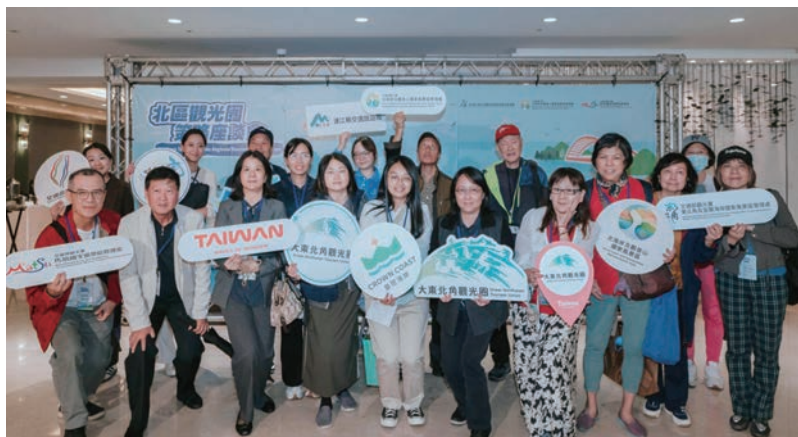
▲交通部觀光署東北角及宜蘭海岸風景區管理處、北海岸及觀音山國家風景區管理處、馬祖風景區管理處11／18共同舉辦「北區觀光圈策略座談會」。