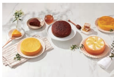
▲理想店鋪的蛋糕選擇多元，深獲消費者喜愛。

選用花蓮純正蜂蜜，搭配法國鐵塔牌奶油、天然養生黃金蛋等食材，以西班牙傳統蒸烤法製作，出爐的成品切開便能看見如蜂巢般的紋理，搭配著濕潤、柔軟的濃郁香氣，這便是獲獎無數的花蓮理想大地渡假飯店招牌之一：蜂巢糕。