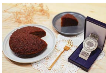
▲因為對於用料的堅持，讓商品多次榮獲獎項肯定。

而這種好滋味不一定要跨越山海才能品嚐到，在新北林口、機捷A9站旁的「理想店鋪」裡，同樣能大啖到這份來自花蓮的甜蜜好滋味。