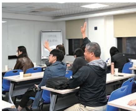
▲活動安排有獎徵答環節，並送出來自埃及的精美禮品。

Kuoni Tumlare於1906年創立，擁有超過百年的目的地管理經驗，業務內容遍及全世界，並於全球33個國家設立服務據點，提供客戶系列團、技術參訪、教育旅遊、旅遊諮詢、獎勵旅遊、會議及展覽等多樣化服務。Kuoni Tumlare提供多元的旅遊產品組合，除為歐洲旅遊市場穩站先驅，更向外拓展不同旅遊目的地，滿足旅客各種需求。近